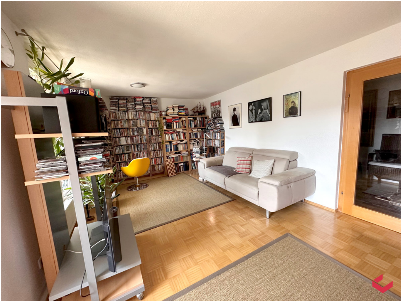
Sehr gepflegte 3-Zimmerwohnung in Bregenz